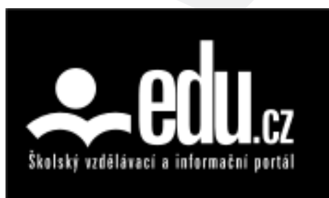
Bílá inverzní varianta